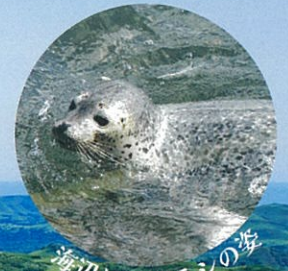
海辺にアザラシの姿