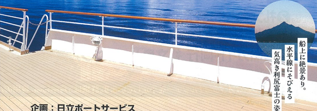
船上に絶景あり。 水平線にそびえる 気高き利尻富士の姿